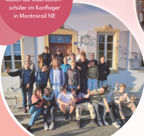
Viel Spass und Überraschungen er- lebten die Oberstufen- schüler im Konflager in Montmirail NE