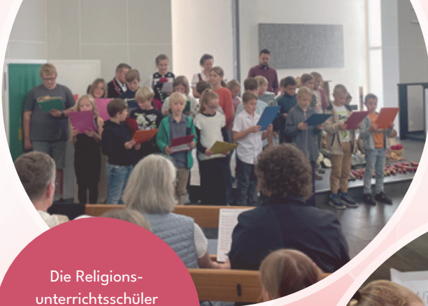
Die Religions- unterrichtsschüler gestalteten den Ernte- dank-Gottesdienst in Willisau mit