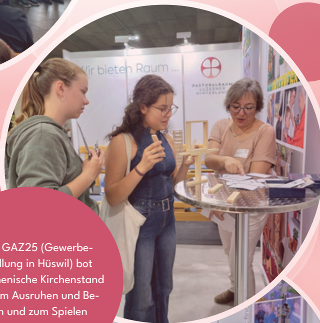
An der GAZ25 (Gewerbe- ausstellung in Hüswil) bot der ökumenische Kirchenstand Platz zum Ausruhen und Be- sinnen und zum Spielen