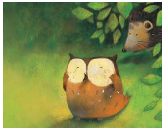
Bildkarte Nr. 3 aus «Heule Eule»

Geschichte stehen. Auf spielerische Art entdecken die Kinder den Raum der Kirche und erleben den Gottesdienst. Anschliessend gibt es für alle ein kleines Zvieri.