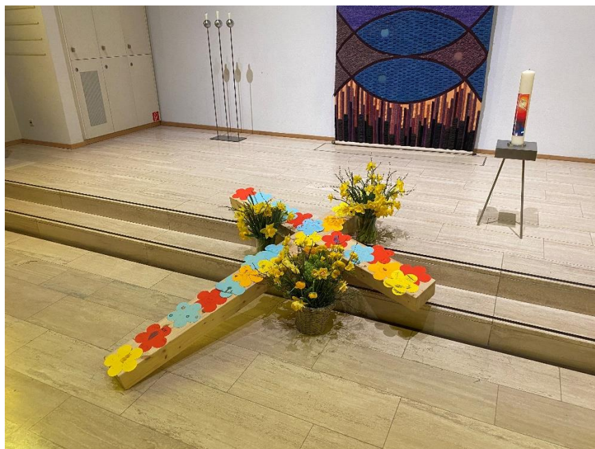
Das blühende Osterkreuz, Ostersonntag, 2023