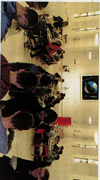
Suppenzmittag in der Kirche.