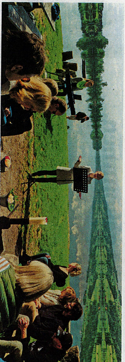
Besinnliche Morgenstimmung beim Outdoor-Gottesdienst am Baldeggersee.